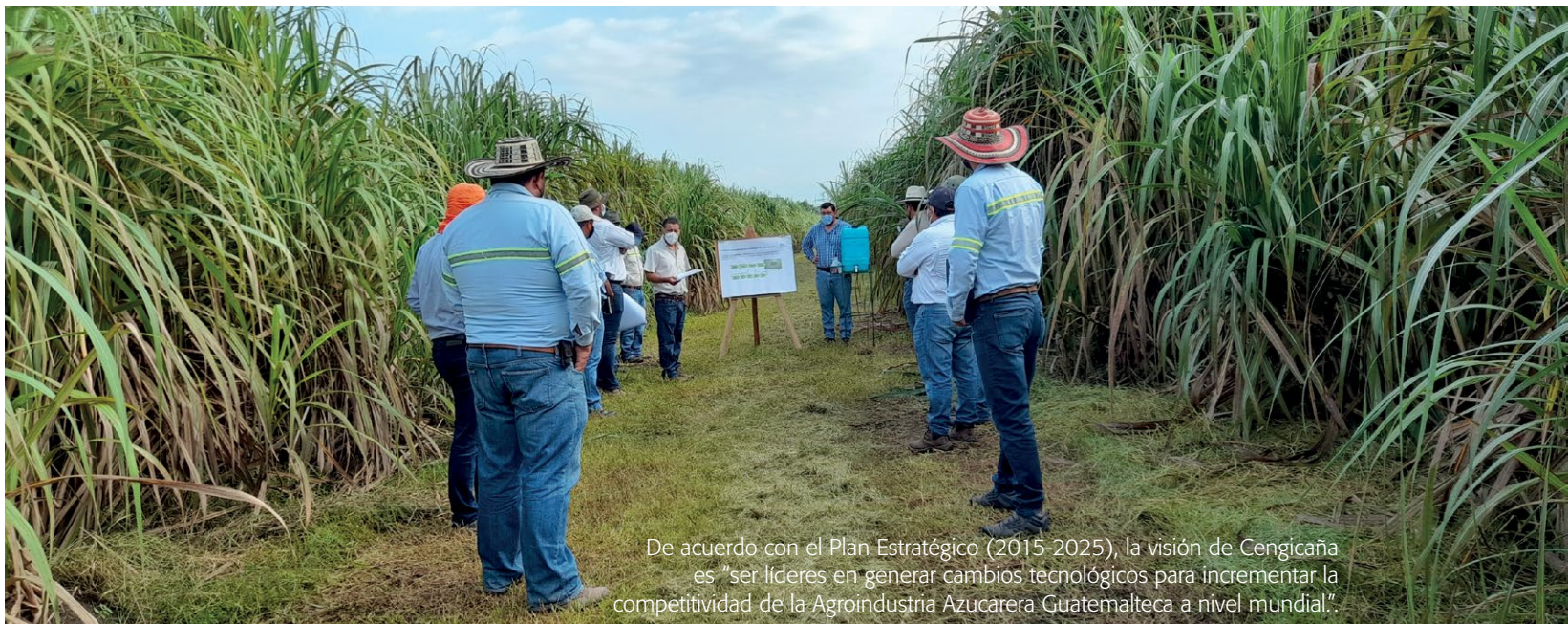
De acuerdo con el Plan Estratégico (2015-2025), la visión de Cengicaña es "ser líderes en generar cambios tecnológicos para incrementar la competitividad de la Agroindustria Azucarera Guatemalteca a nivel mundial."

El Programa Transferencia y Capacitación Tecnológica incluye áreas de trabajo sobre transferencia de tecnología, creación de capacidades y productividad. Además, cuenta con una biblioteca con información integral y servicios que apoyan la Agroindustria Azucarera. El plan anual de capacitación incluye cursos, estudios certificados con diploma, seminarios y programas de maestría. En el desarrollo de capacidades, se han realizado 5,304 eventos de capacitación para personal de agroindustria de 1992 a 2020 con 131,781 participantes. A nivel de postgrado, se han formado nuevos profesionales en las áreas industrial y agrícola con la realización de 5 diplomados certificados en Ingeniería del Azúcar (300 profesionales) y 4 en Ingeniería de la Caña de Azúcar (380 profesionales), ambos con una duración de 160 horas. Además, los programas de Diplomado de Supervisión se han llevado a cabo con 18 eventos y 1,204 supervisores. Otras actividades de desarrollo de capacidades incluyen: Diplomados de Gestión de Calidad en ISO 9001-2000, 9001-2008 y 9001-2015; Buenas Prácticas de Manufactura; Buenas Prácticas Agrícolas y Buenas Prácticas de Laboratorio; y 5 Programas de Maestría en colaboración con las universidades Del Valle de Guatemala y Galileo en los que se han formado 300 profesionales (Cengicaña, 2022).